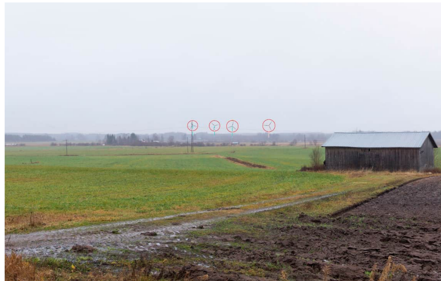
Voimalat korostettuna merkivärillä myös puuston ja maaston taakse jääviltä osin.