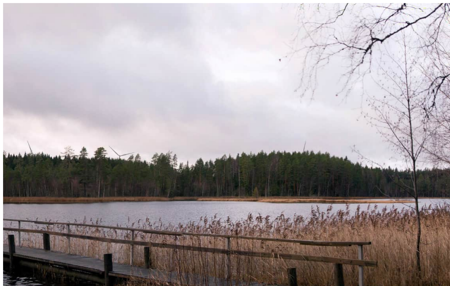
Kuvauspaikka 3 Atsinlampi. Havainnekuva, voimaloiden kokonaiskorkeus 250 m. Kuvattu 50 mm polttovälillä. Etäisyys lähimpään voimalaan noin 2,7 km.