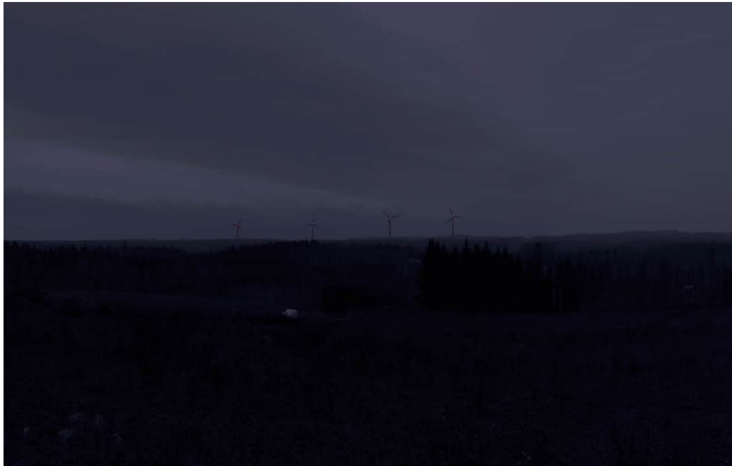
Kuvauspaikka 2 Kortemäki. Havainnekuva lentoestevalot, voimaloiden kokonaiskorkeus 250 m. Kuvankäsittelyllä muokattu pimeäkuva. Kuvattu 50 mm polttovälillä. Etäisyys lähimpään voimalaan noin 6,5 km.