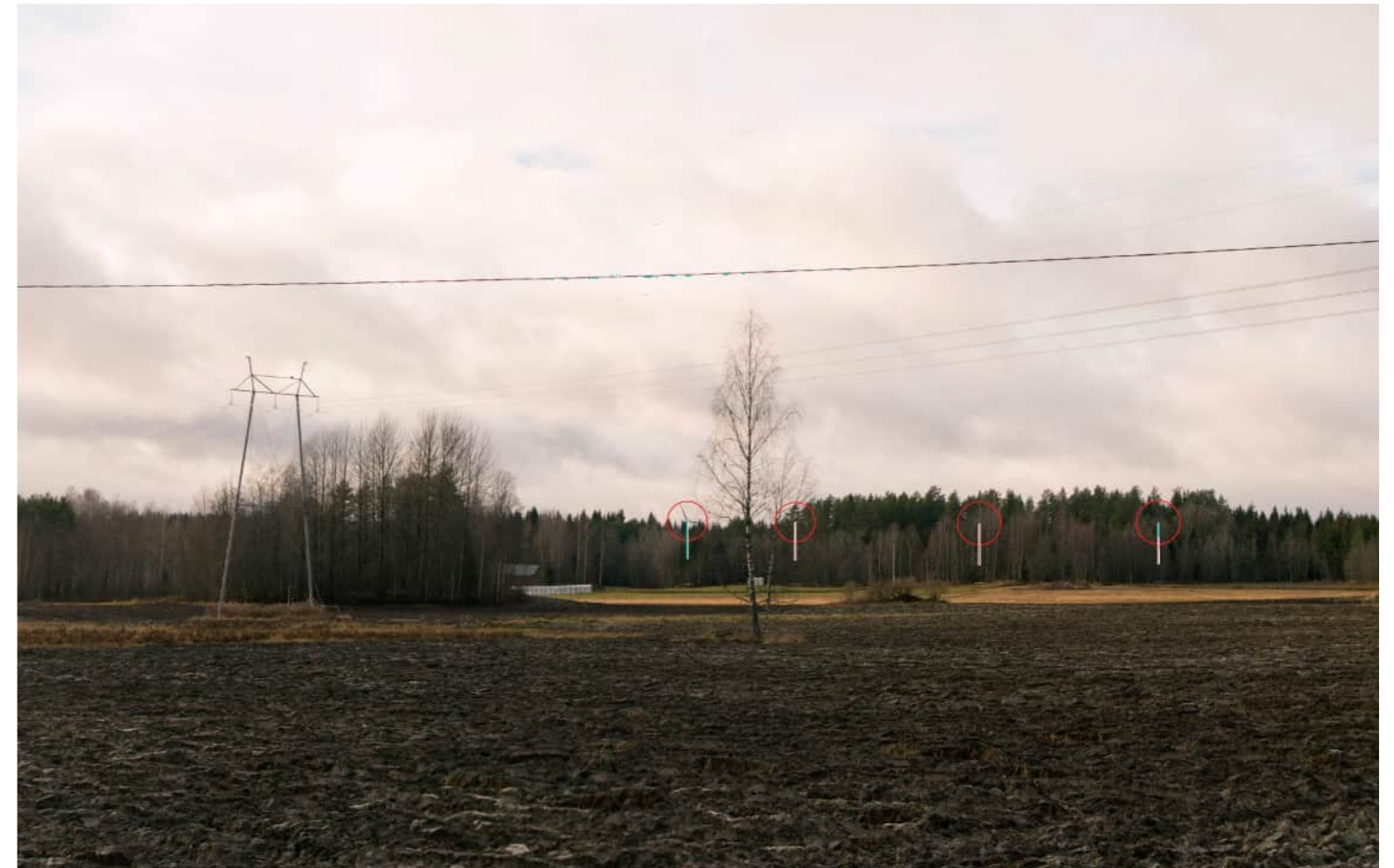
Voimalat korostettuna merkivärillä myös puuston ja maaston taakse jääviltä osin.