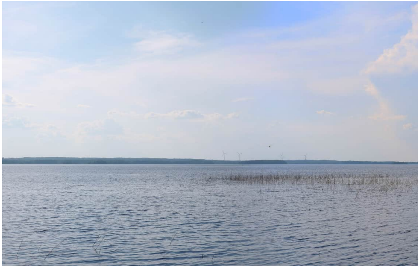
Kuvauspaikka 11 Siikasalmi Heposelän yli. Havainnekuva, voimaloiden kokonaiskorkeus 250 m. Kuvattu 50 mm polttovälillä. Etäisyys lähimpään voimalaan noin 15,8 km.