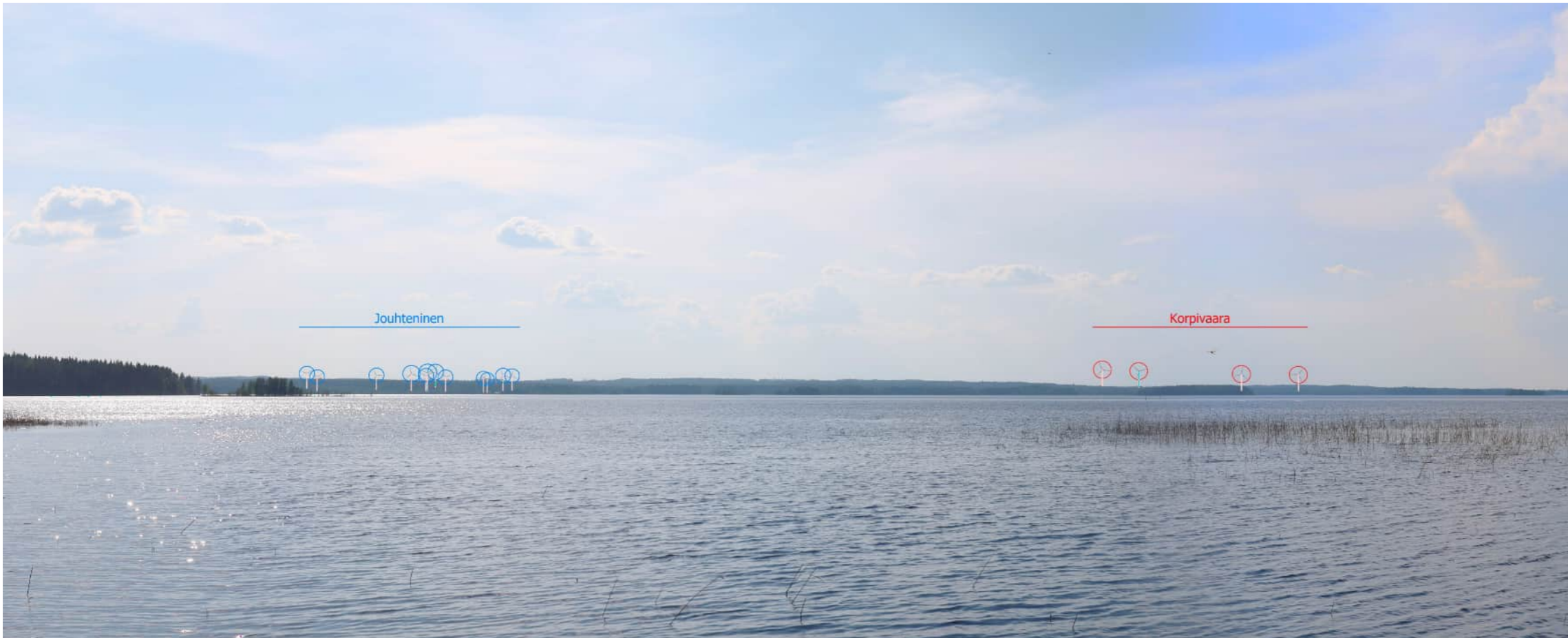
Voimalat korostettuna merkkivärillä myös puuston ja maaston taakse jääviltä osin.