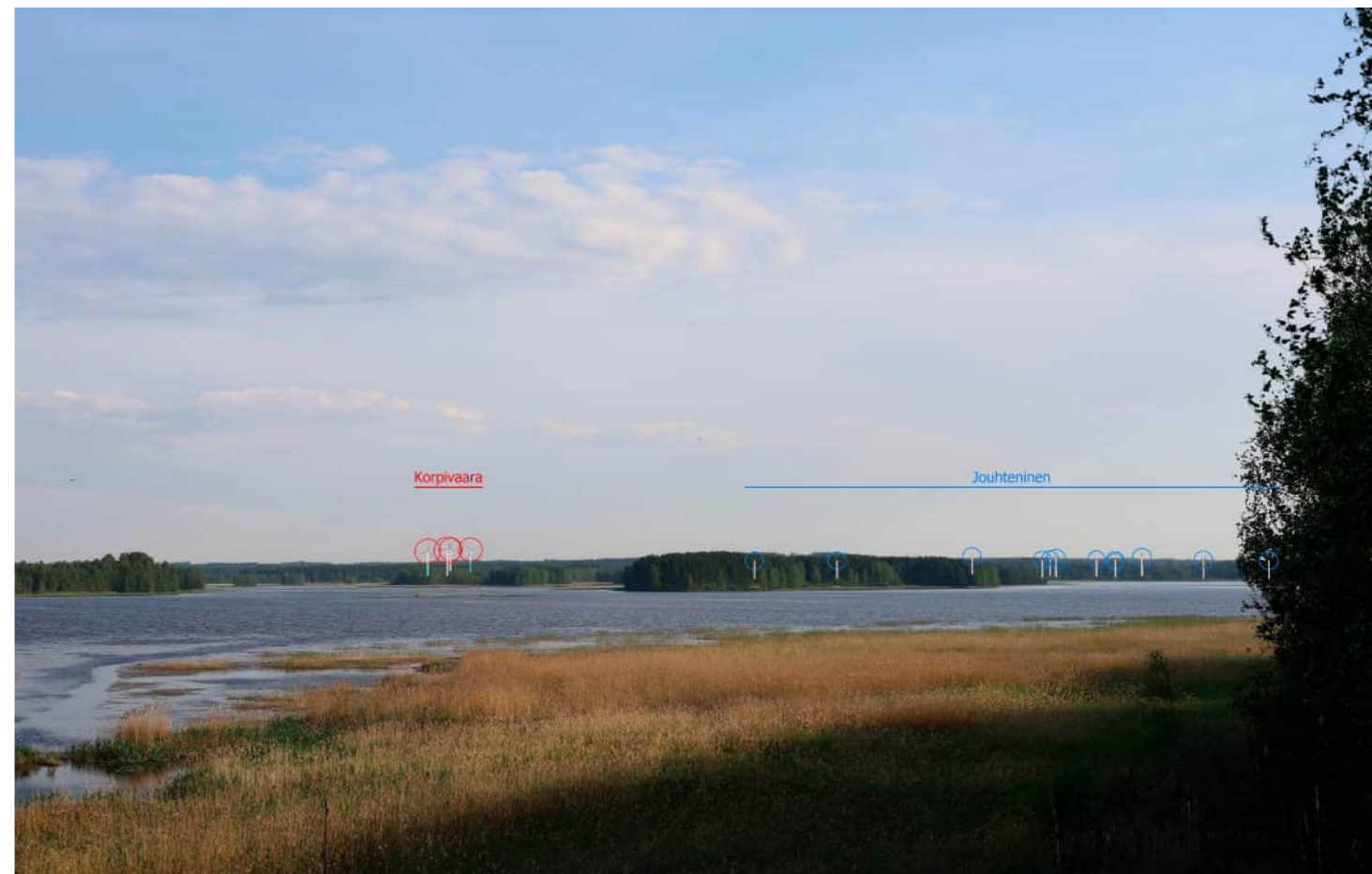
Voimalat korostettuna merkivärillä myös puuston ja maaston taakse jääviltä osin.