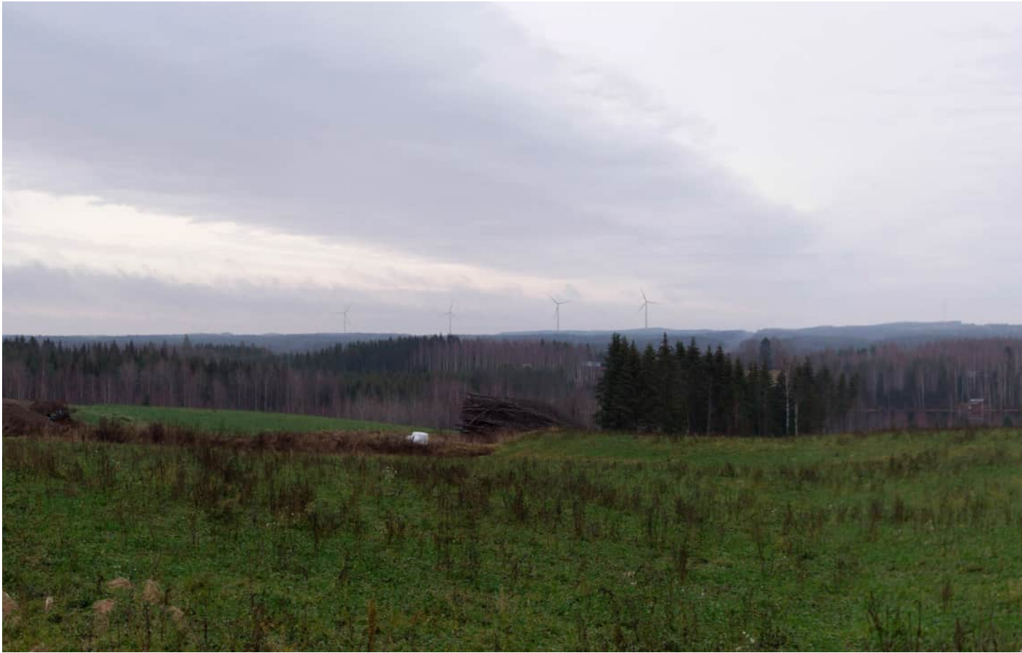
Kuvauspaikka 2 Kortemäki. Havainnekuva, voimaloiden kokonaiskorkeus 250 m. Kuvattu 50 mm polttovälillä. Etäisyys lähimpään voimalaan noin 6,5 km.