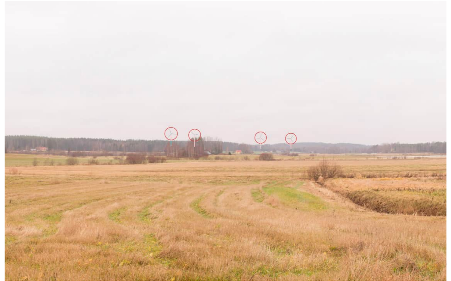
Voimalat korostettuna merkivärillä myös puuston ja maaston taakse jääviltä osin.