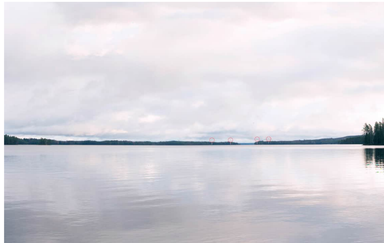
Voimalat korostettuna merkkivärillä myös puuston ja maaston taakse jääviltä osin.