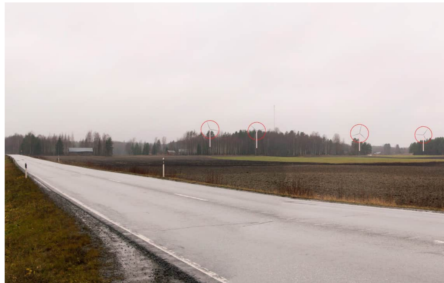
Voimalat korostettuna merkivärillä myös puuston ja maaston taakse jääviltä osin.