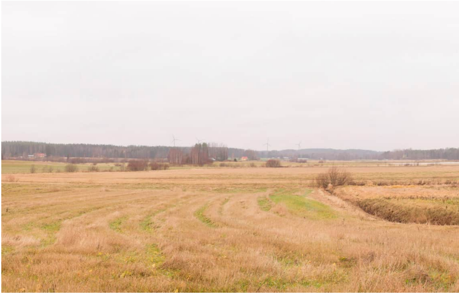
Kuvauspaikka 7 Kaatamo-Ristinkylä. Havainnekuva, voimaloiden kokonaiskorkeus 250 m. Kuvattu 50 mm polttovälillä. Etäisyys lähimpään voimalaan noin 7,6 km.