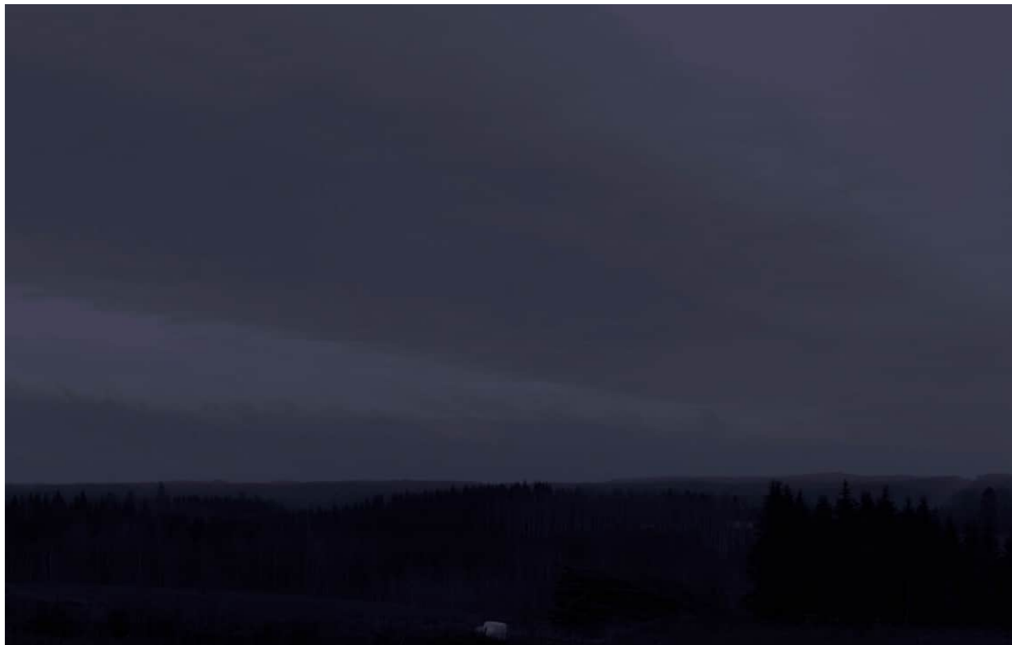
Nykytila, kuvankäsittelyllä muokattu pimeäkuva.