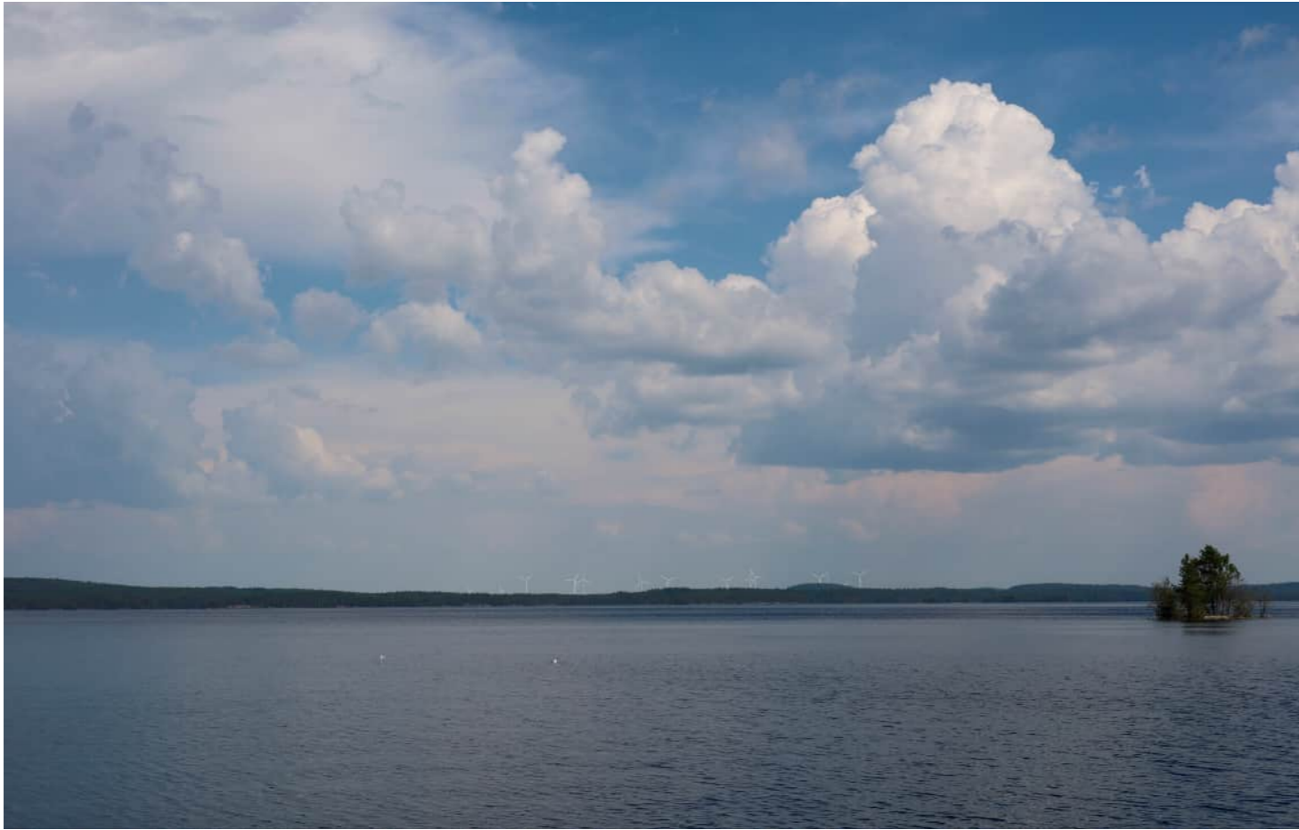
Kuvauspaikka 10 Kuvauspaikka 10 Heinäveden satama, Kermanranta. Havainnekuva yhteisvaikutus. Suunniteltujen Korpivaaran voimaloiden kokonaiskorkeus 250 m ja Jouhtenisen 300 m. Kuvattu 50 mm polttovälillä. Etäisyys lähimpään Jouhtenisen voimalaan noin 15,6 km ja Korpivaaran 26,5 km.