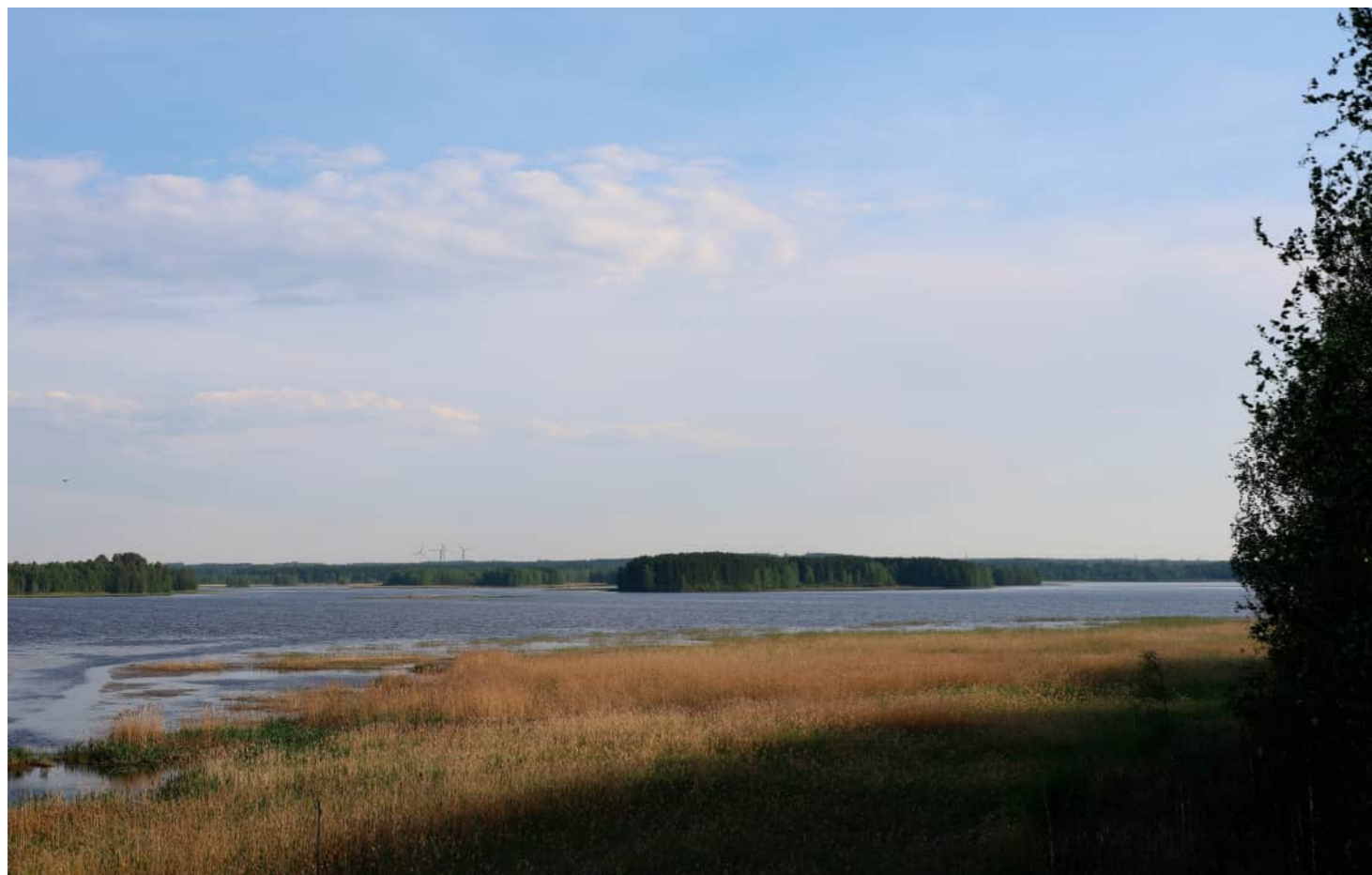
Kuvauspaikka 12 Sysmäjärvi. Havainnekuva yhteisvaikutus. Suunniteltujen Korpivaaran voimaloiden kokonaiskorkeus 250 m ja Jouhtenisen 300 m. Kuvattu 50 mm polttovälillä. Etäisyys lähimpään Korpivaaran voimalaan noin 12,5 km ja Jouhtenisen 21,2 km.