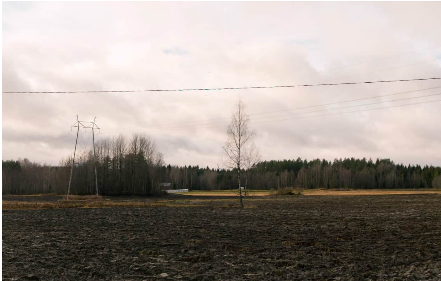
Kuvauspaikka 5 Liettilän peltoalue. Havainnekuva, voimaloiden kokonaiskorkeus 250 m. Kuvattu 50 mm polttovälillä. Etäisyys lähimpään voimalaan noin 7,4 km.