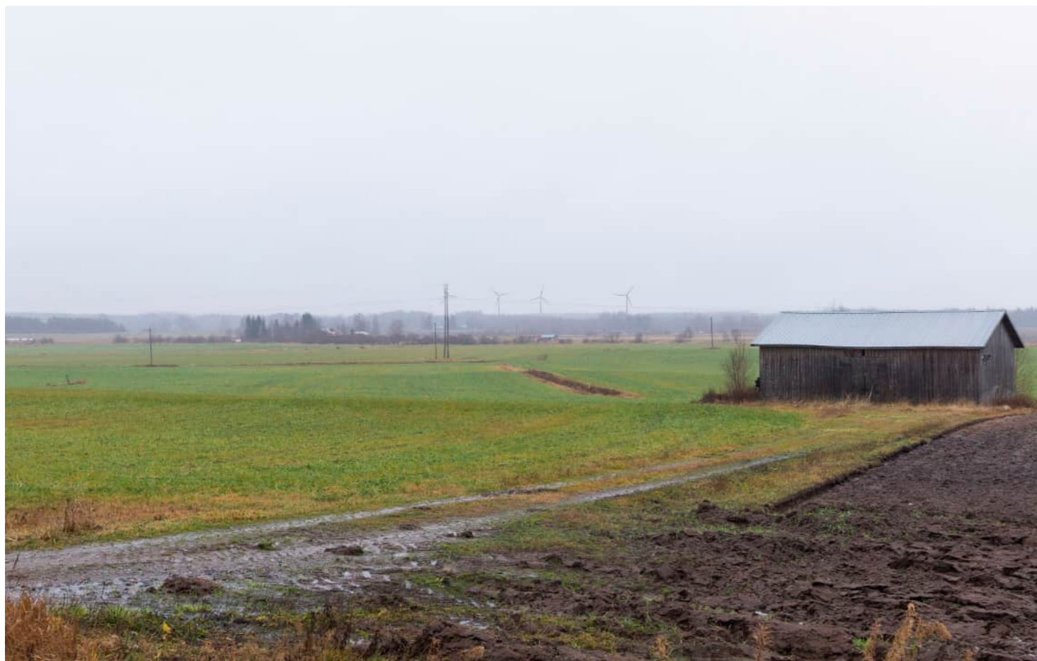
Kuvauspaikka 4 Kuopiontien varsi. Havainnekuva, voimaloiden kokonaiskorkeus 250 m. Kuvattu 50 mm polttovälillä. Etäisyys lähimpään voimalaan noin 8,7 km.