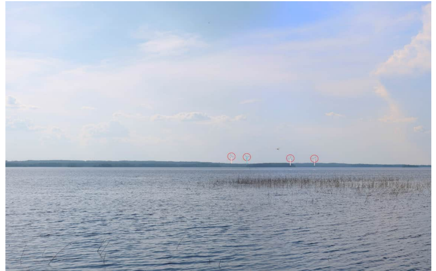
Voimalat korostettuna merkivärillä myös puuston ja maaston taakse jääviltä osin.