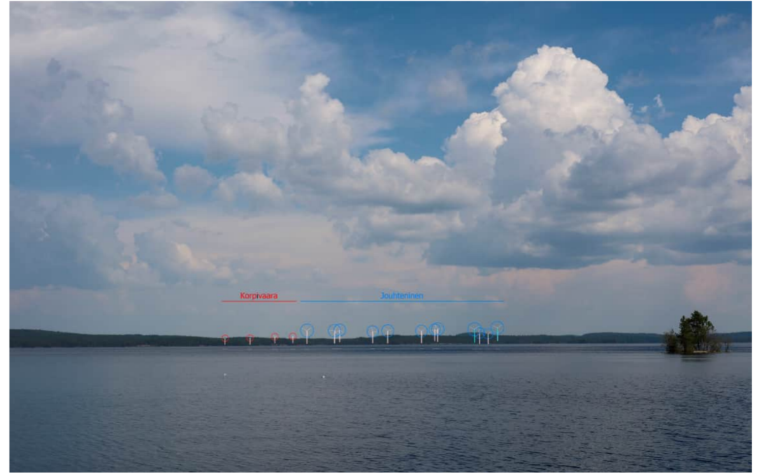
Voimalat korostettuna merkivärillä myös puuston ja maaston taakse jääviltä osin.