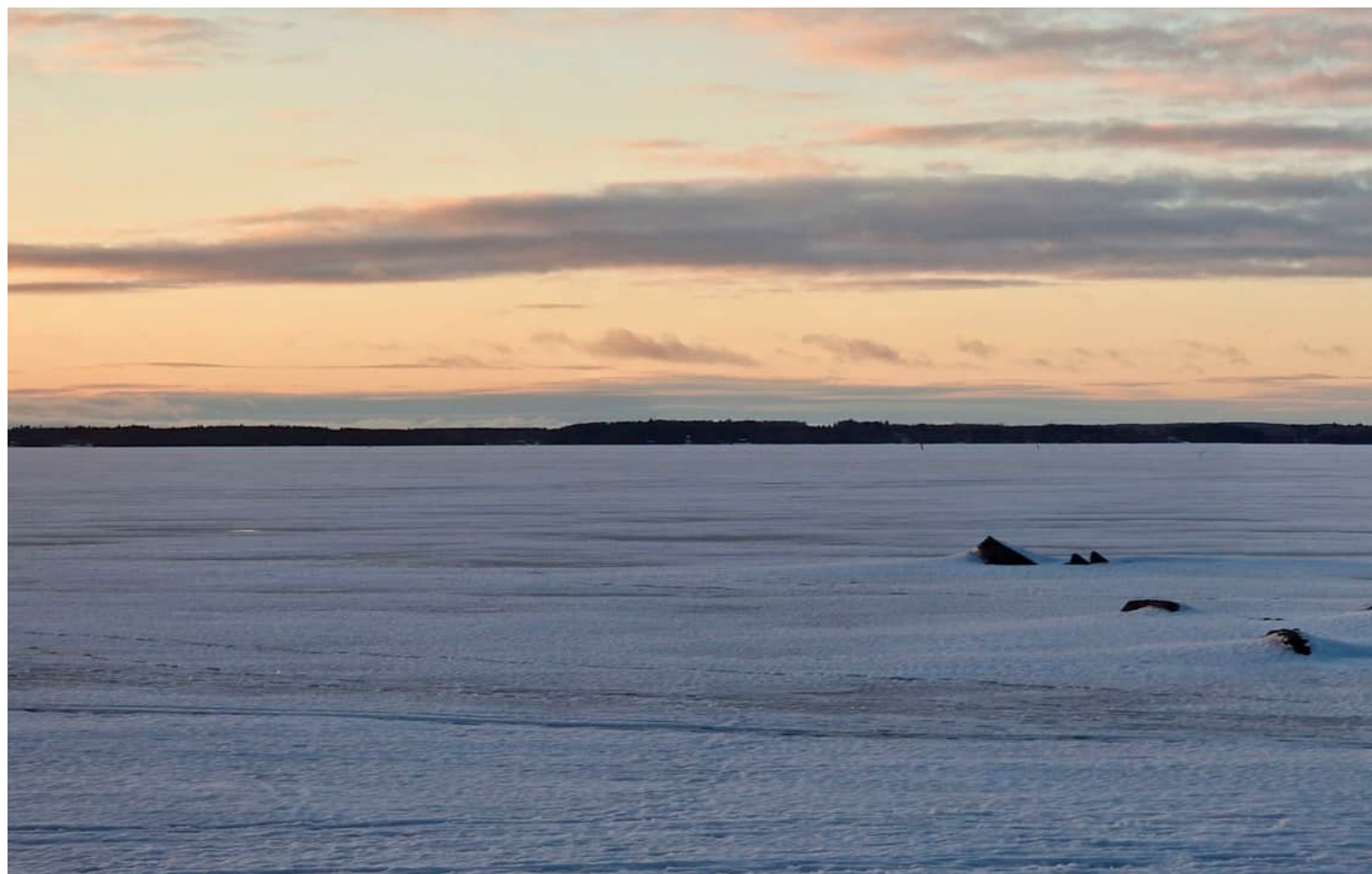
Kuvauspaikka 8 Joensuun Kuhasalo. Havainnekuva, voimaloiden kokonaiskorkeus 250 m. Kuvattu 50 mm polttovälillä. Etäisyys lähimpään voimalaan noin 33,7 km.