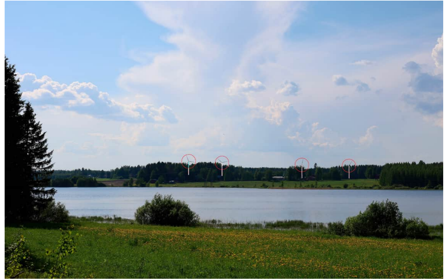
Voimalat korostettuna merkkipäällällä myös puuston ja maaston taakse jääviltä osin.