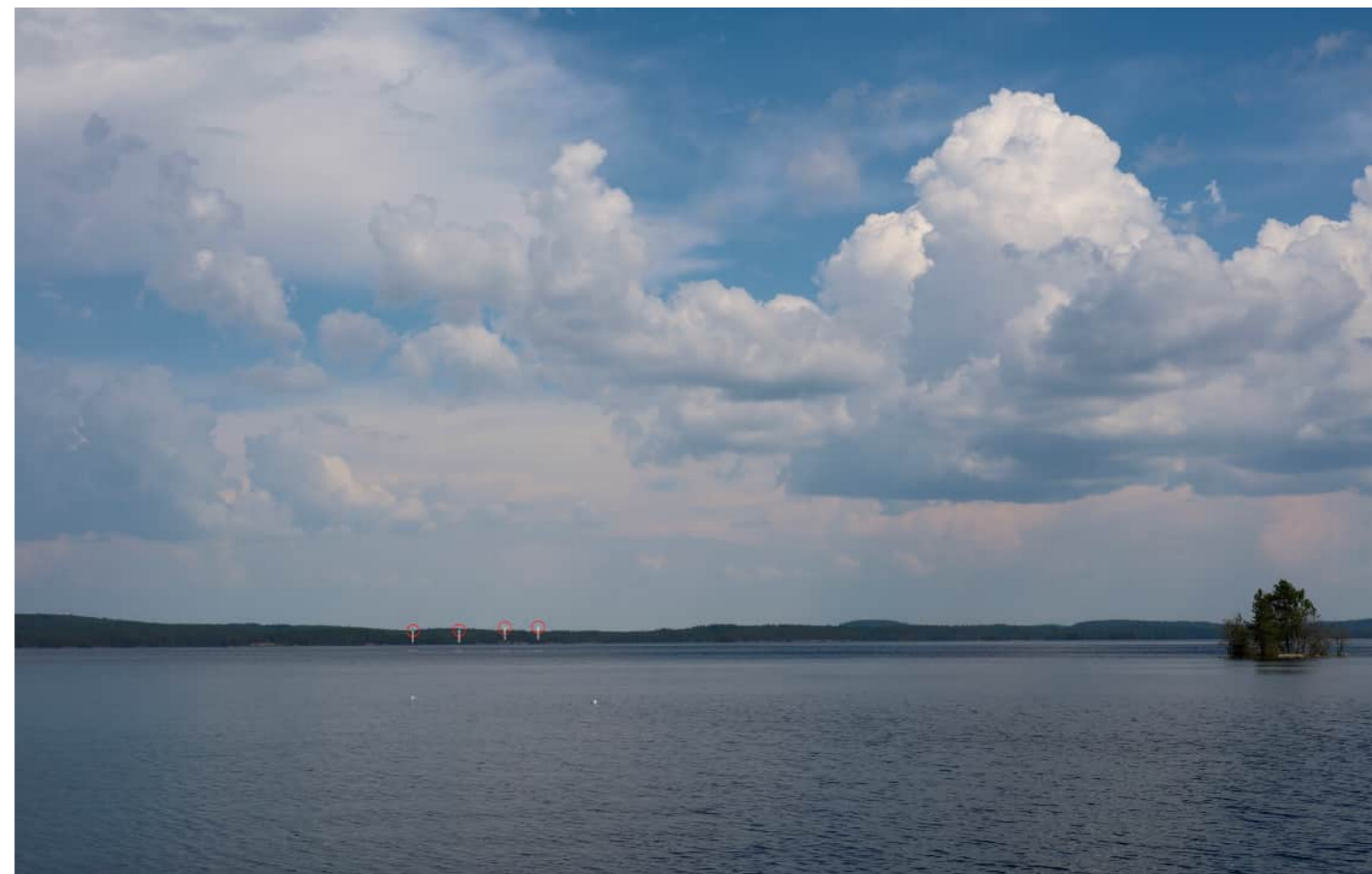
Voimalat korostettuna merkkipäällä myös puuston ja maaston taakse jääviltä osin.