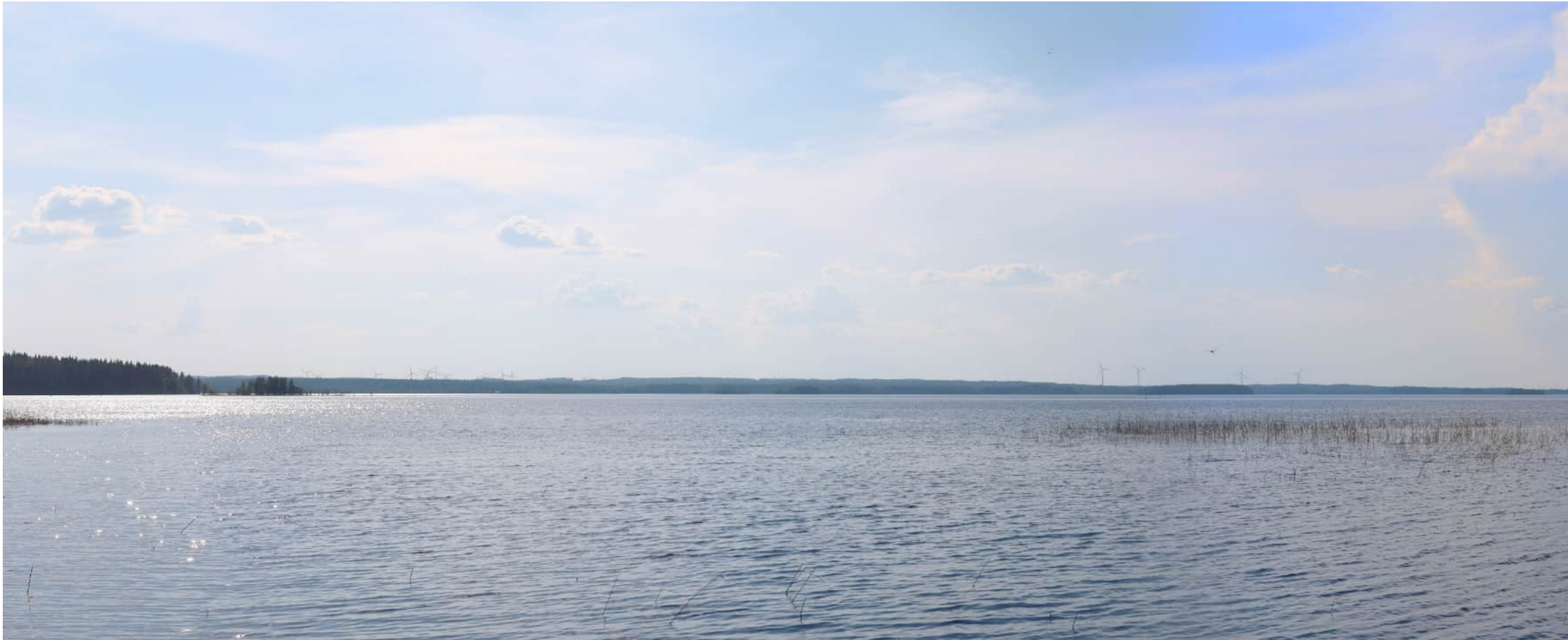
Kuvauspaikka 11 Siikasalmi Heposelän yli. Havainnekuva yhteisvaikutus. Suunniteltujen Korpivaaran voimaloiden kokonaiskorkeus 250 m ja Jouhtenisen 300 m. Kuvattu 50 mm polttovälillä. Etäisyys lähimpään Korpivaaran voimalaan noin 15,8 km ja Jouhtenisen 17,9 km.