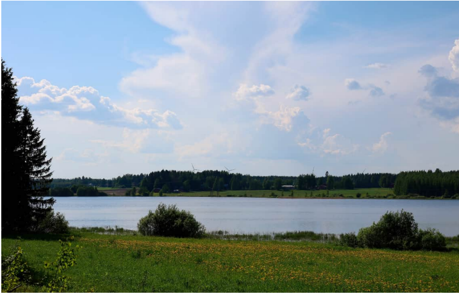
Kuvauspaikka 9 Rikinlampi Kapaniemi. Havainnekuva, voimaloiden kokonaiskorkeus 250 m. Kuvattu 50 mm polttovälillä. Etäisyys lähimpään voimalaan noin 7,6 km.