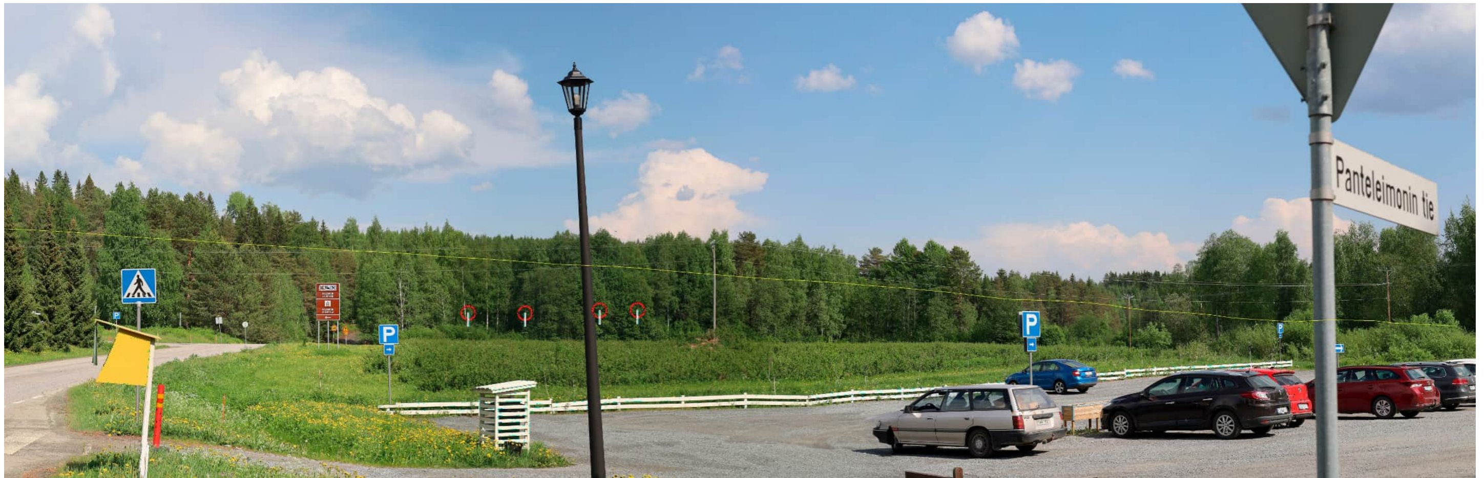
Kuvauspaikka 13 Valamon luostari. Havainnekuvasa voimalat korostettuna merkivärillä puuston ja maaston taakse jääviltä osin. Suunniteltujen Korpivaaran voimaloiden kokonaiskorkeus 250 m. Etäisyys lähimpään voimalaan noin 14,1 km. (maastonmuodot peittävät näkyvyyden)