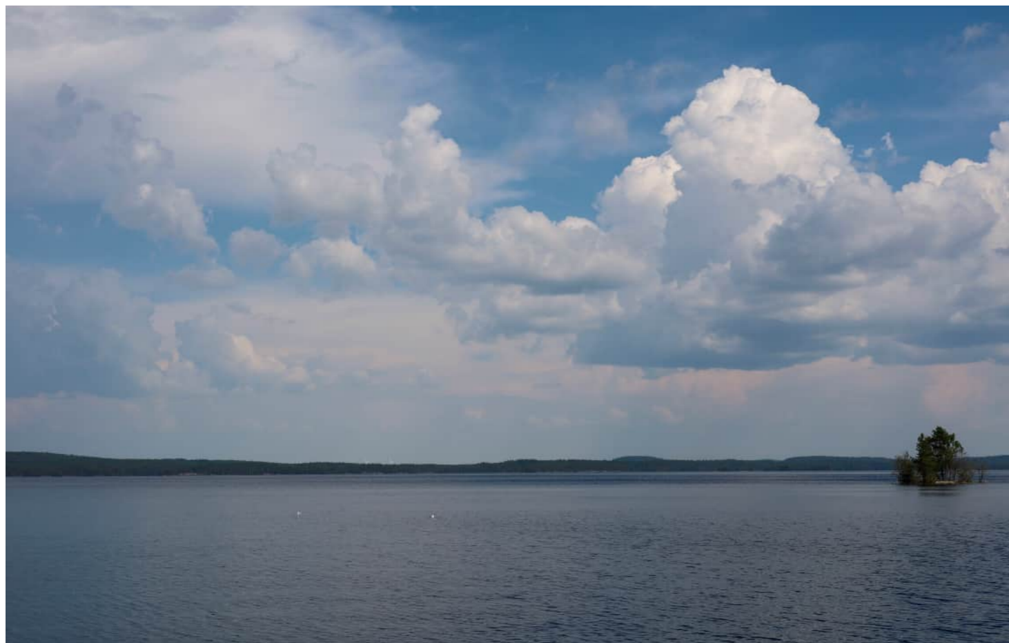
Kuvauspaikka 10 Heinäveden satama, Kermanranta. Havainnekuva, voimaloiden kokonaiskorkeus 250 m. Kuvattu 50 mm polttovälillä. Etäisyys lähimpään voimalaan noin 26,5 km.