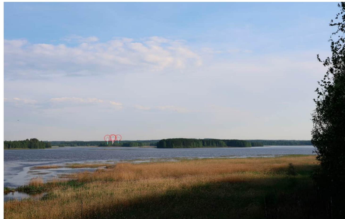
Voimalat korostettuna merkivärillä myös puuston ja maaston taakse jääviltä osin.