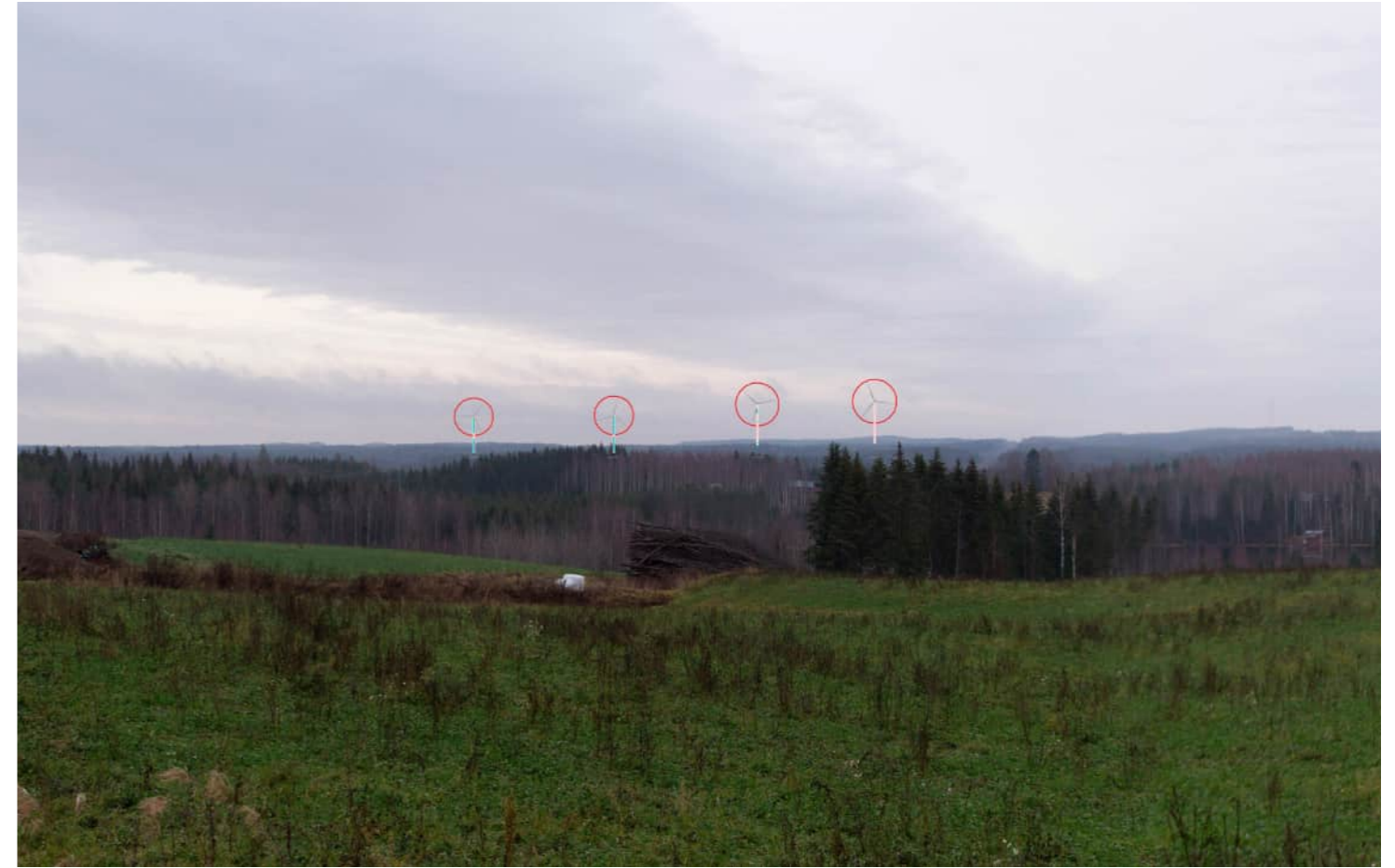
Voimalat korostettuna merkkipäällä myös puuston ja maaston taakse jääviltä osin.