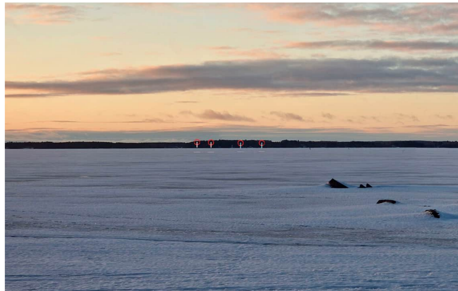
Voimalat korostettuna merkivärillä myös puuston ja maaston taakse jääviltä osin.