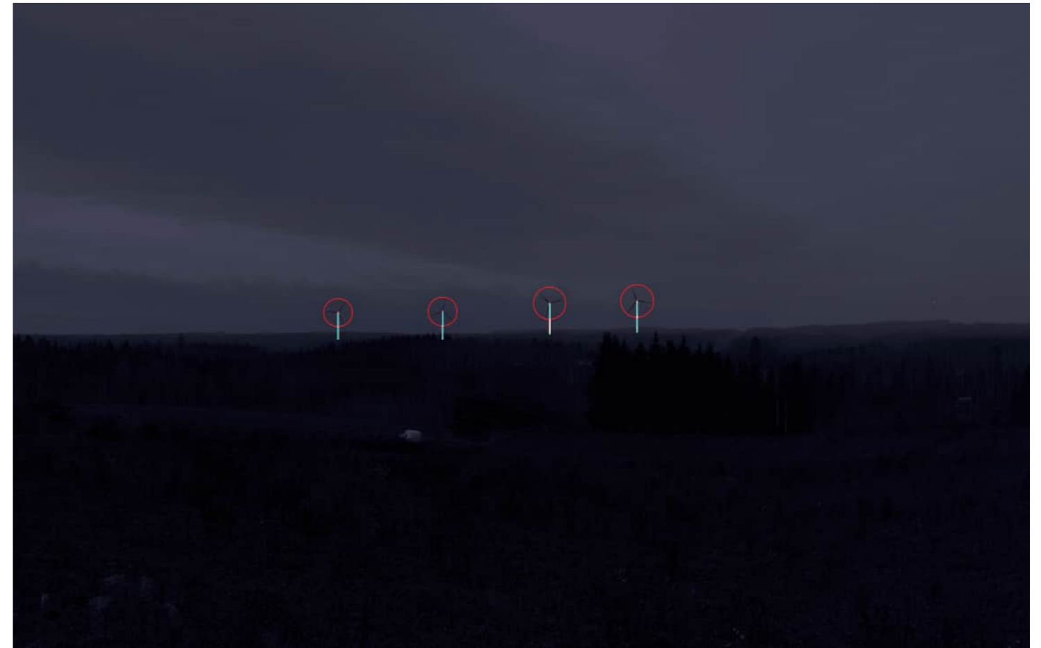
Voimalat korostettuna merkkivärillä myös puuston ja maaston taakse jääviltä osin.