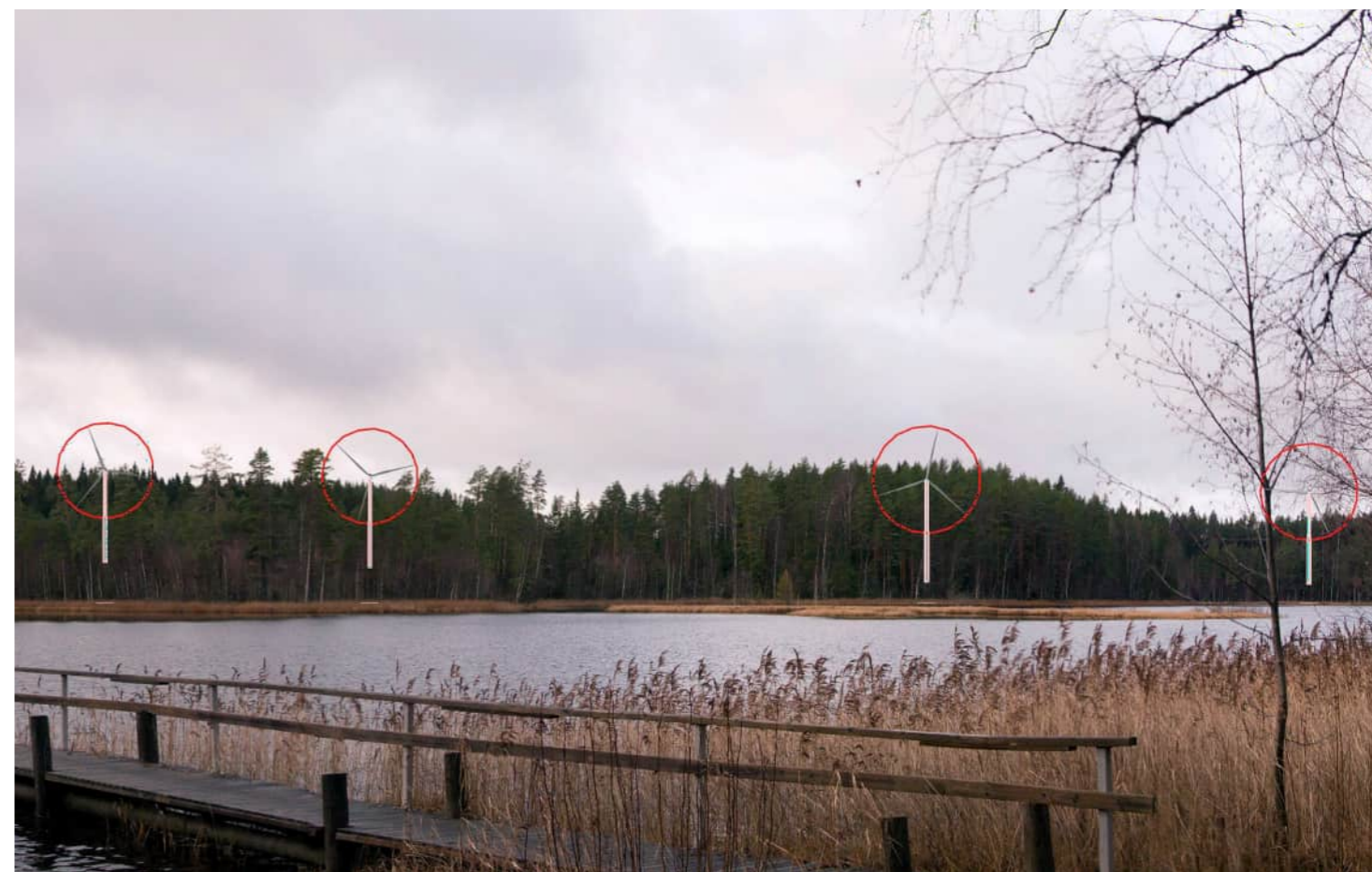
Voimalat korostettuna merkkipäällällä myös puuston ja maaston taakse jääviltä osin.