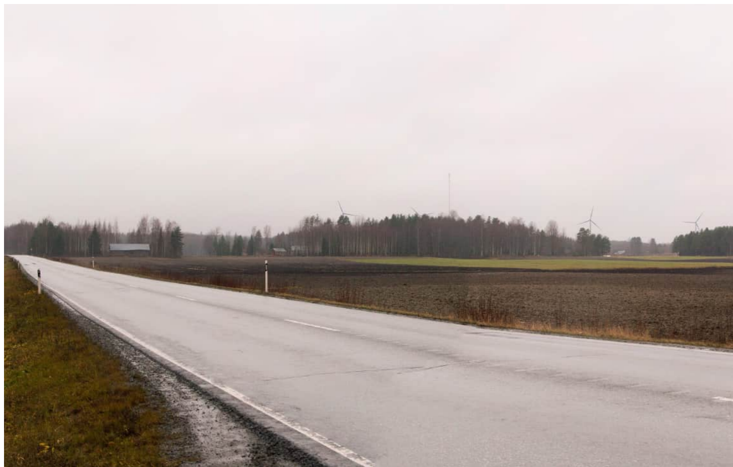
Kuvauspaikka 6 Valtatien 23 varsi. Havainnekuva, voimaloiden kokonaiskorkeus 250 m. Kuvattu 50 mm polttovälillä. Etäisyys lähimpään voimalaan noin 5,3 km.